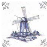
Dibujo Nr.1 SR6002 ▲ R222