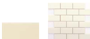
Enmallado Liso 5x10 SN....15* ▲ T260