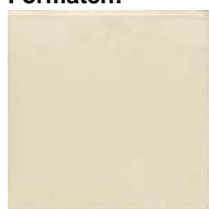
Liso 15x15 SN....01* ▲ T030