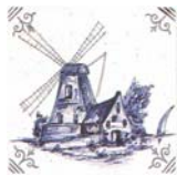
Dibujo Nr.4 SR6005 ▲ R222

* Onderstaande kleurcode invullen op de stippellijn: