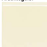
Romo 1/C 15x15 SN....02* ▲ R020