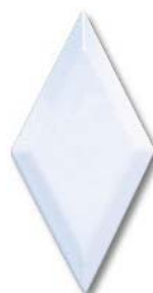
Biselado 10x20 SN....85* ▲ T410