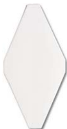
Liso 10x20 SN....81* ▲ T411