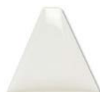
Alcochado 10x10 SN....83* ▲ R024