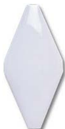
Alcochado 10x20 SN....82* ▲ T450