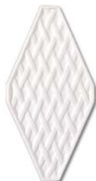
Relieve 10x20 SN....84* ▲ T450