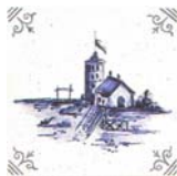
Dibujo Nr.2 SR6003 ▲ R222