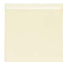
Romo 2/C 10x10 SN....06* ▲ R030