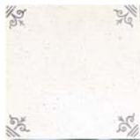
Cantonera SR6001 ▲ T130