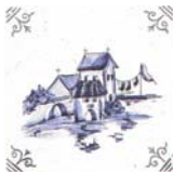
Dibujo Nr.3 SR6004 ▲ R222