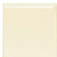
Romo 2/C 15x15 SN....03* ▲ R030