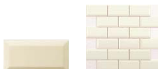
Enmallado Biselado 5x10 SN....16* ▲ T260