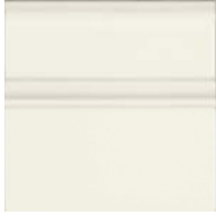
Rodapié Clasico 15x15 SN....51* ▲ R090